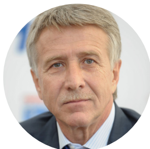
Leonid Mikhelson Président du conseil d'administration de «Novatek»