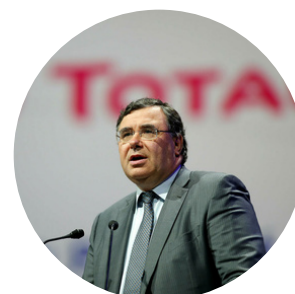
Patrick Pouyanné Président-Directeur Général de TotalEnergies