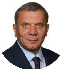
Youri Borissov Vice-Premier ministre de la Fédération de Russie