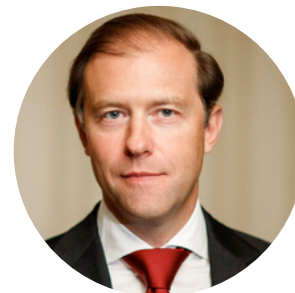
Denis Mantourov Ministre de l'industrie et du commerce de la Fédération de Russie