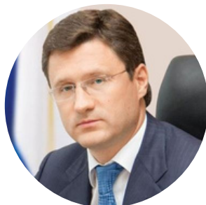
Alexandre Novak Vice-Premier ministre de la Fédération de Russie