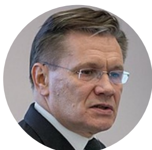
Alexeï Likhatchev Directeur général de «Rosatom»