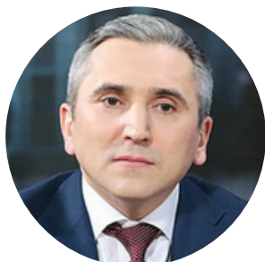
Александр Моор Губернатор Тюменской области