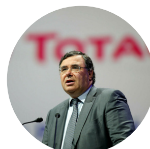
Патрик Пуянне Главный исполнительный директор TotalEnergies