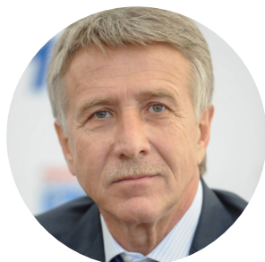
Леонид Михельсон Председатель правления ПАО «Новатэк»