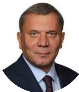
Юрий Борисов Заместитель председателя правительства Российской Федерации