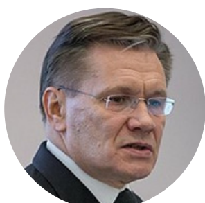
Алексей Лихачёв Генеральный директор ГК «Росатом»