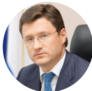
Александр Новак Заместитель председателя правительства Российской Федерации