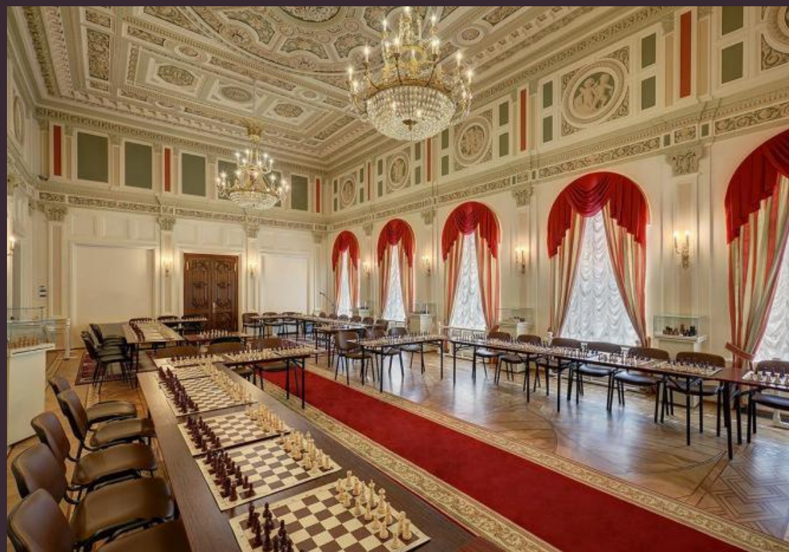
Российская Шахматная Федерация